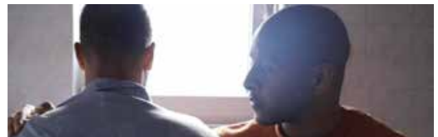
© Georges Maikel Pires Monteiro - IT GETS BETTER

Les conditions sanitaires n'ayant pas permis pas de profiter