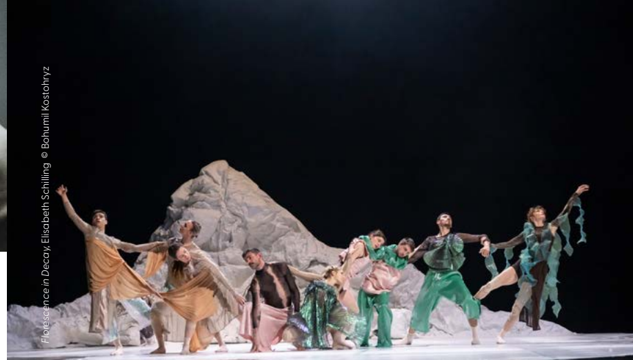
Florescence in Decay, Elisabeth Schilling

Avant de découvrir les 17 et 18 avril p. 16 les 2 premières des pièces de la nouvelle génération de jeunes chorégraphes luxembourgeois-es Serge Daniel Kaboré et Djamila Polo, laissez-vous surprendre avec un petit avant-goût de quelques minutes de chacune de leur œuvre !