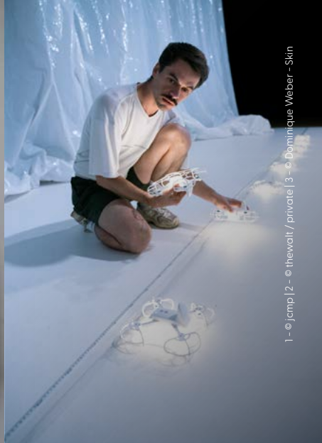
1 - © jcmp | 2 - © thewalt / private | 3 - © Dominique Weber - Skin