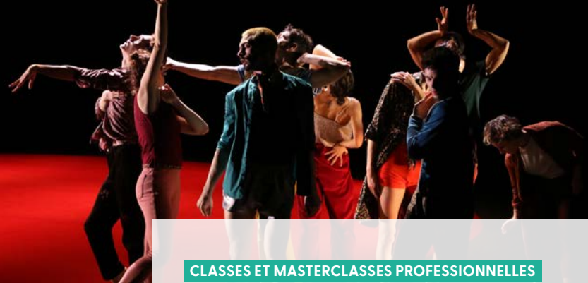
MAGNIFIQUES de Michel Kelemenis

Avec un attachement particulier à l'écriture du mouvement et ce, avec fidélité à la notion de ligne, Yvann Alexandre s'est imposé comme le représentant d'une danse abstraite. Sa gestuelle très précise fourmille de détails et s'organise comme une calligraphie de l'intime. En plus de ses créations, présentées sur de nombreuses scènes et festivals prestigieux en France et à l'étranger, il est aussi l'invité d'Écoles d'enseignement supérieur en danse (Paris, Lyon, Québec) ou de compagnies prestigieuses (Nordwest Tanzcompagnie).