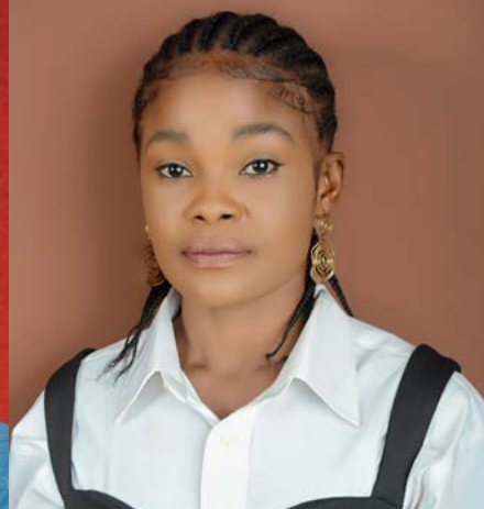
1 - © João Catarino | 2 - © Declan Murphy | 3 - © Alexander Polina | 4 - © tendance photographie