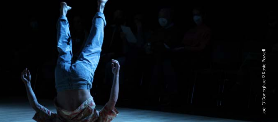
Joël O'Donoghue