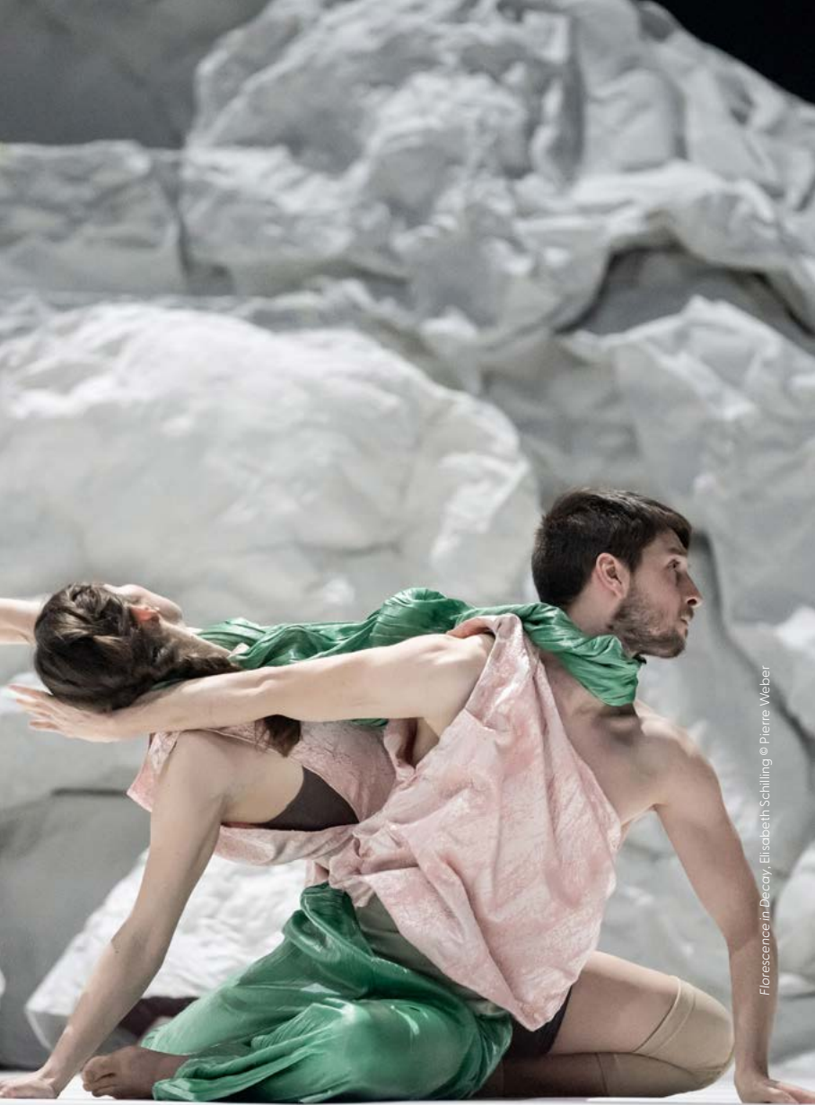
Florescence in Decay, Elisabeth Schilling