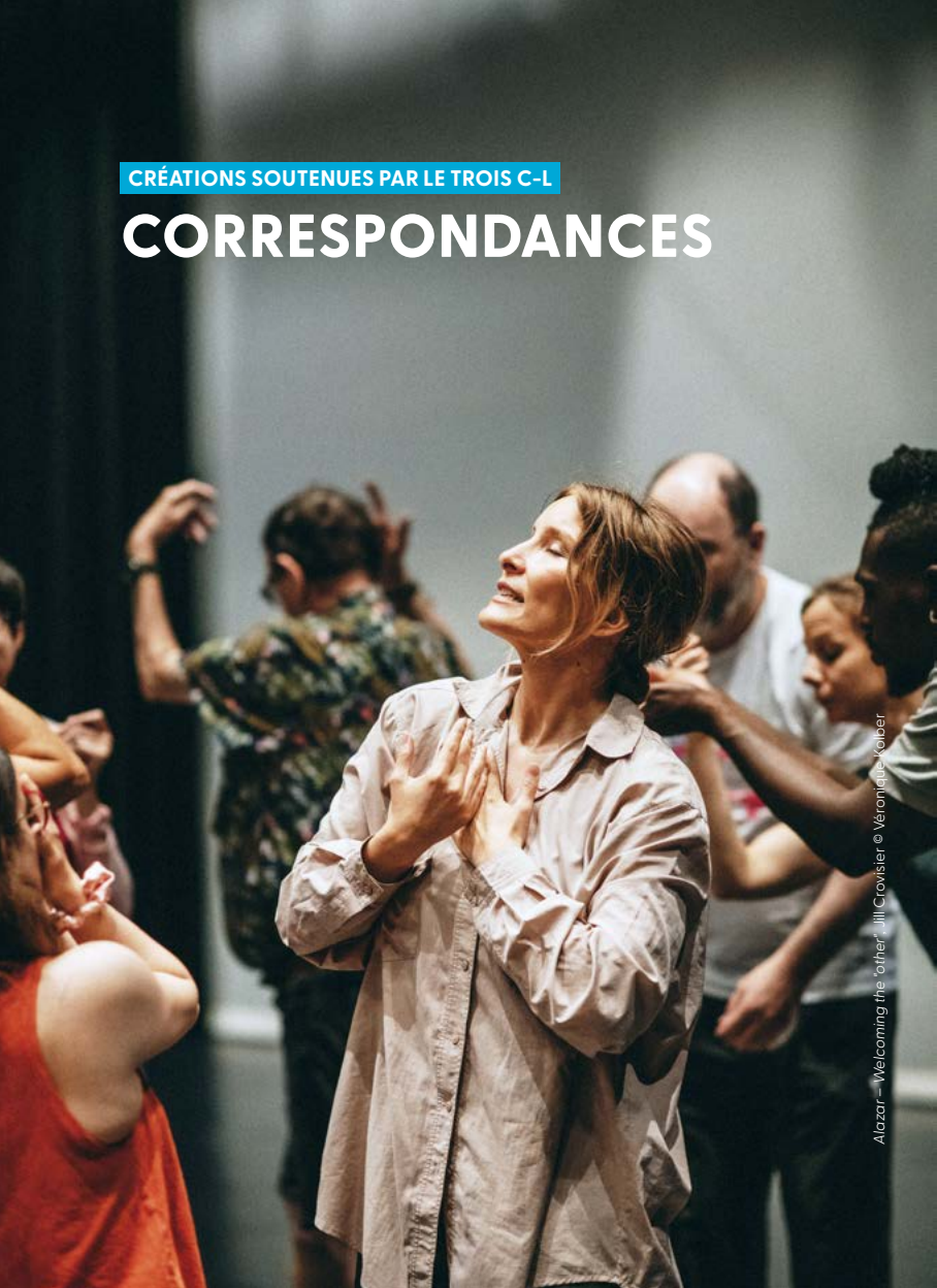
Alazar – Welcoming the “other” - Jill Crovisier

Le Mierscher Theater présente Correspondances : quatre nouvelles créations chorégraphiques, réalisées pour et avec l'Ensemble blanContact. Trois d'entre elles sont soutenues par le TROIS C-L :