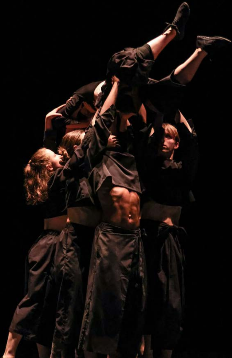
Threads, Loïc Faquet © Sud Reportage