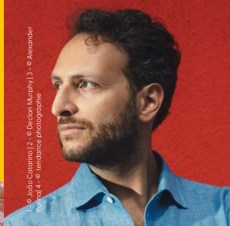
1 - © João Catarino | 2 - © Declan Murphy | 3 - © Alexander Polina | 4 - © tendance photographie