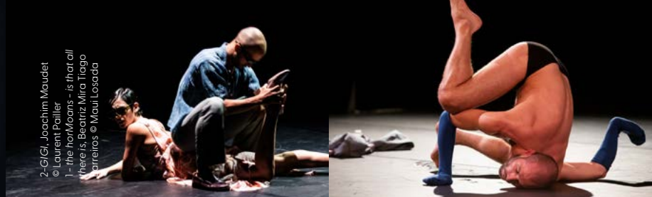
2-GIGI, Joachim Maudet 1 - the horMoans - is that all there is, Beatriz Mira & Tiago Barreiros

Guidé·es par des chorégraphes aux styles variés, les participant·es peuvent y explorer librement le mouvement, qu'ils soient passionné·es ou débutant·es.