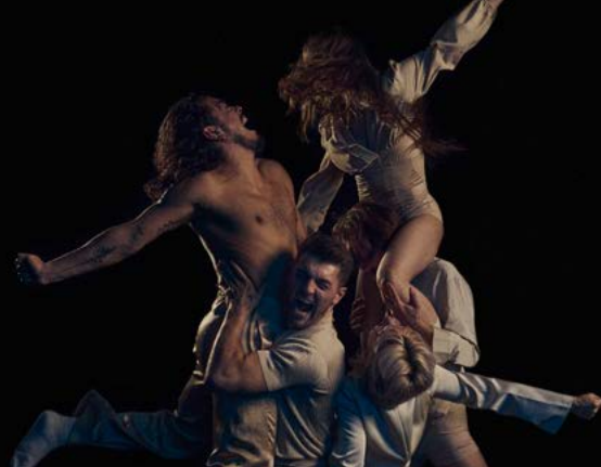
Sans quoi nous crèverons, Virginie Brunelle

Parfois calme, parfois très dynamique, cette séance est une invitation à se découvrir en dansant. Un moment ludique pour développer le sens du rythme, la coordination... et le plaisir de danser ensemble !