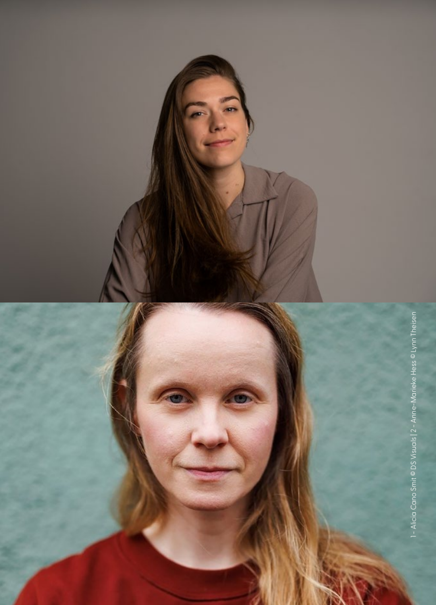
1 - Alicia Cano Smit | 2 - Anne-Mareike Hess