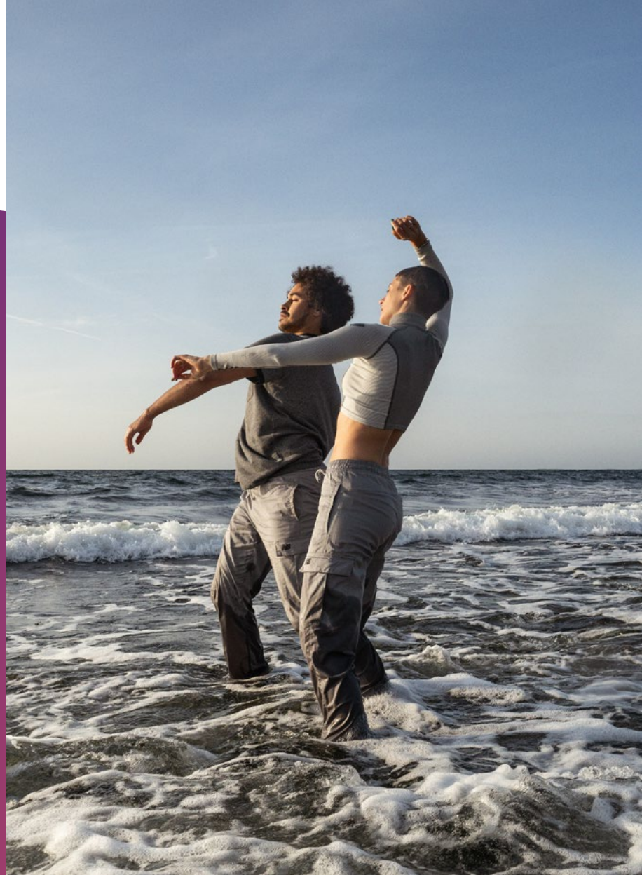
Photo couverture: Waterkind , Land before time Concept graphique: Graphisterie Générale