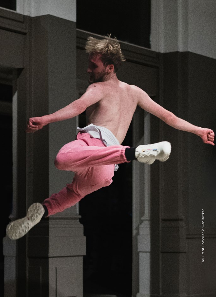
The Great Chevalier