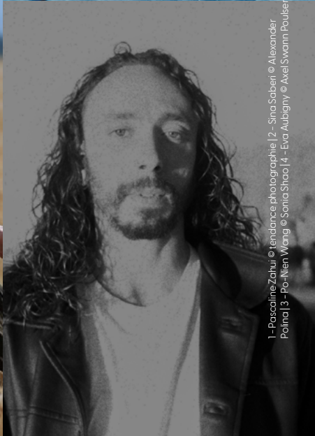
1 - Pascaline Zahui | 2 - Sina Saberi | 3 - Po-Nien Wang | 4 - Eva Aubigny