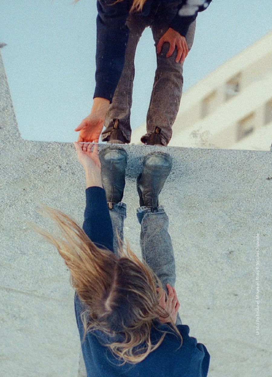
Urtica (la brûlure), Maureen Nass