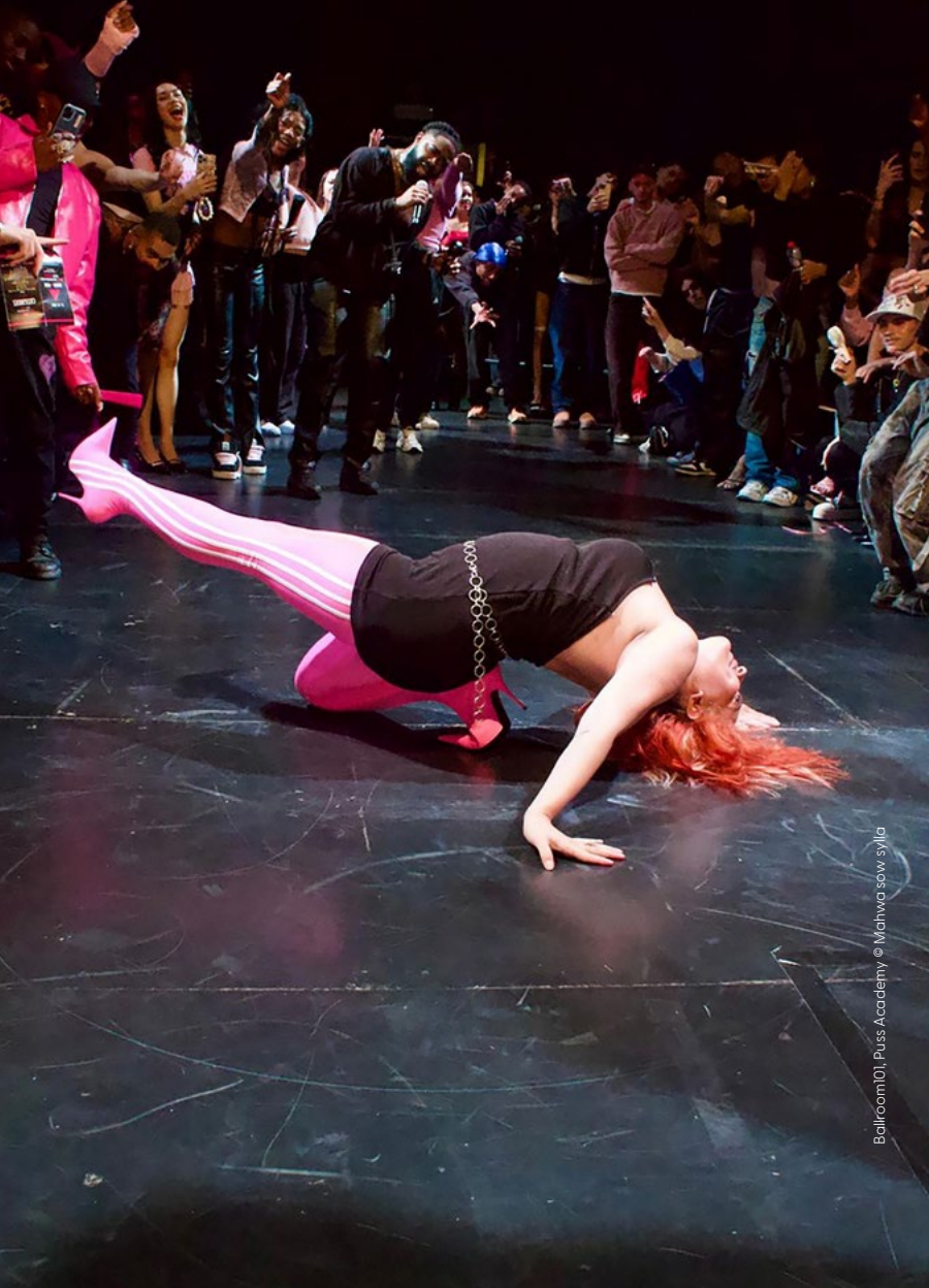
Ballroom101, Puss Academy