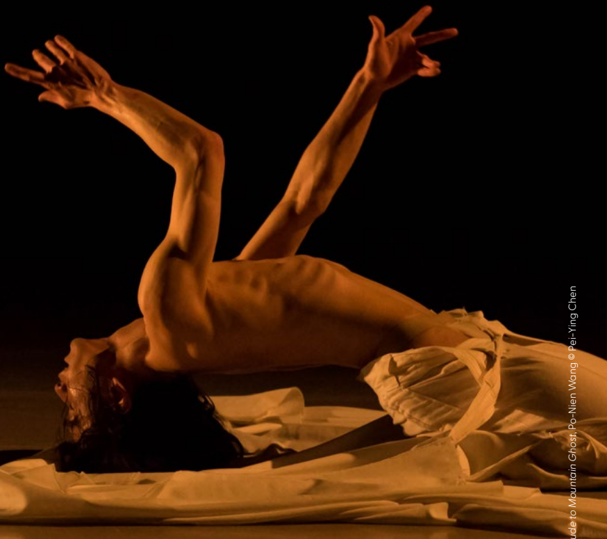
Prelude to Mountain Ghost, Po-Nien Wang © Pei-Ying Chen