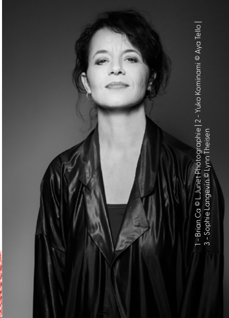
1 - Brian Ca | 2 - Yuko Kominami | 3 - Sophie Langevin